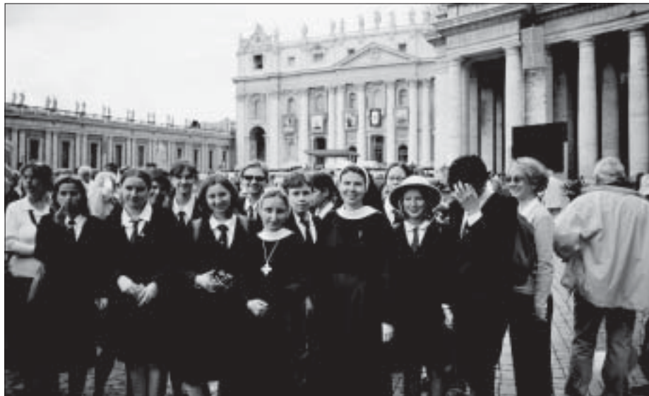
Liceum Sióstr Zmartwychwstańek na pielgrzymce w Rzymie