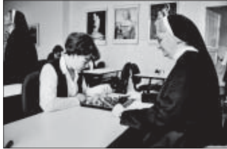
Wspólna rekreacja sióstr i uczennic