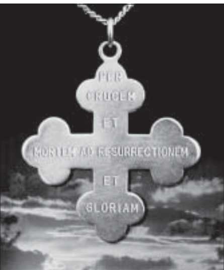
Przez Krzyż i Śmierć do Zmartwychwstania – motto Zgromadzenia