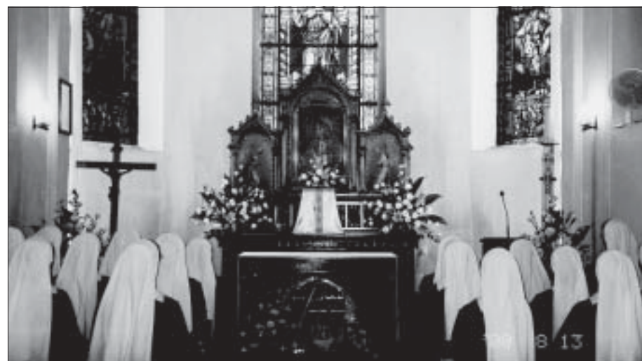
Na modlitwie w kaplicy w Kętach