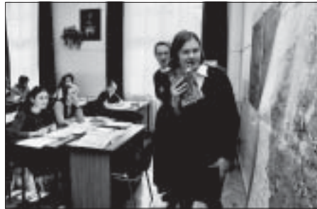
Geografia wcale nie musi być trudna