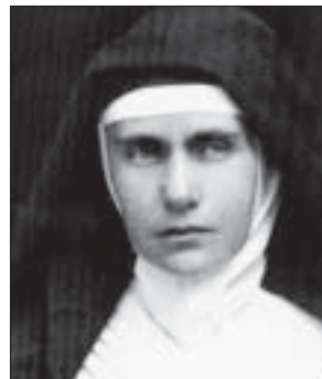
Błogosławiona Siostra Alicja Kotowska