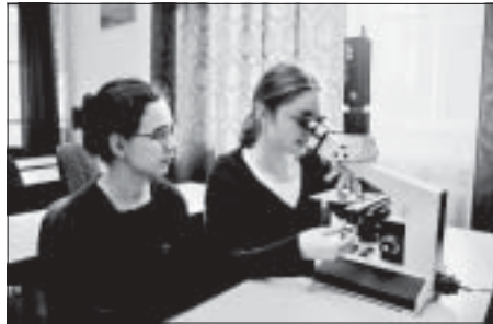
Na lekcji biologii