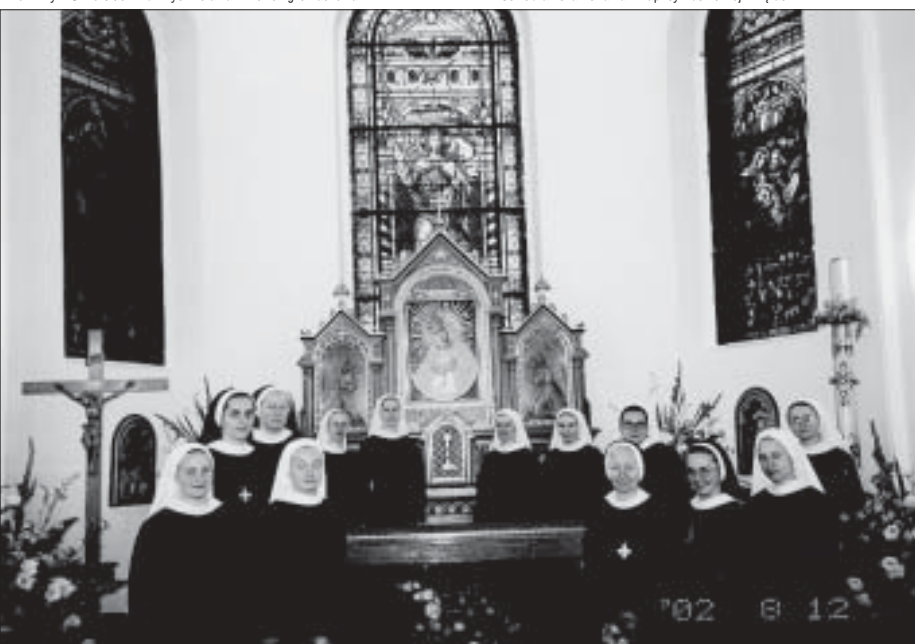
Siostry w prezbiterium kaplicy klasztornej w Kętach