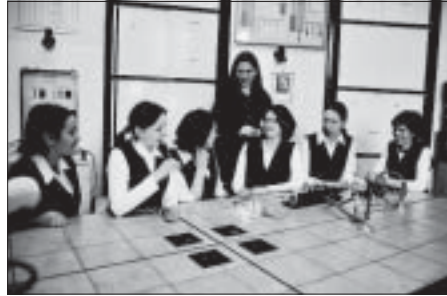
Lekcja fizyki w szkolnym laboratorium