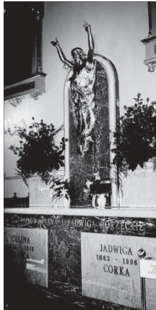
Sarkofag Czcigodnych Sług Bożych Celiny i Jadwigi Borzęckich w kościele parafialnym Kętach