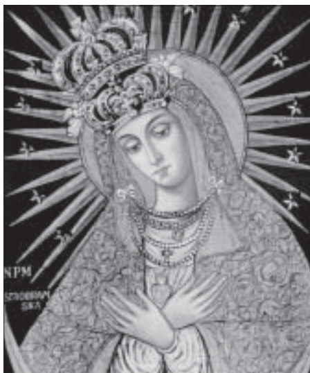
M.B. Ostrobramska z ołtarza w kaplicy klasztornej w Kętach