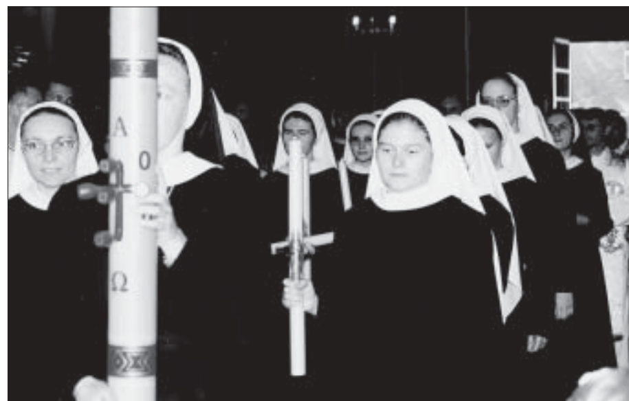
Pierwsza profesja zakonna sióstr