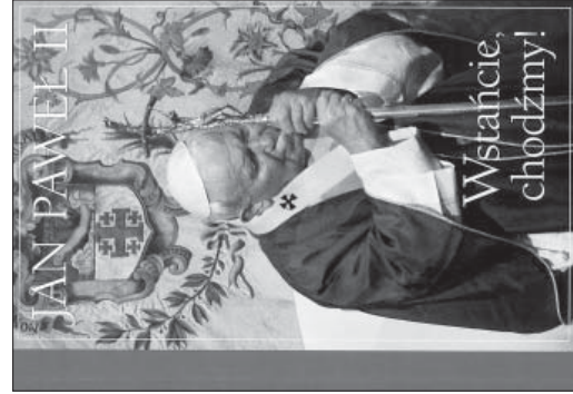
fol. C. Bunikiewicz