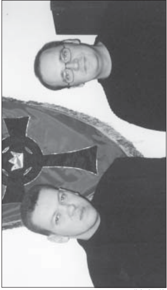
fol. I. Sikora