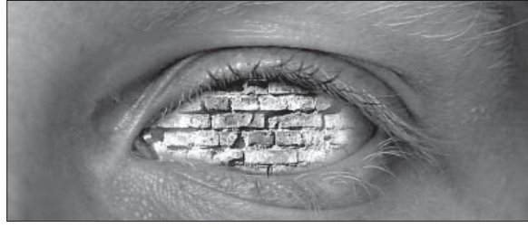
fol. P. Życierski